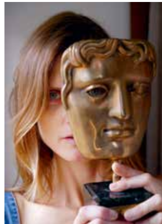
Torbjørn Rødland, The Model , 2017, courtesy de kunstenaar en MACK

is literatuurwetenschapper en kunstcriticus