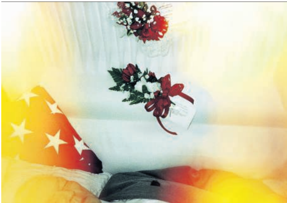
De oude man in zijn doodskist, een van de foto's uit Bertien van Manens nieuwe boek Moonshine .